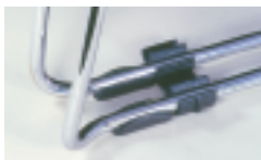
Pièce de connexion.