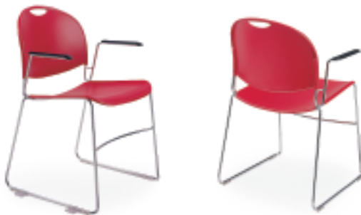
Polypropylène rouge, structure chromée, avec accoudoirs.