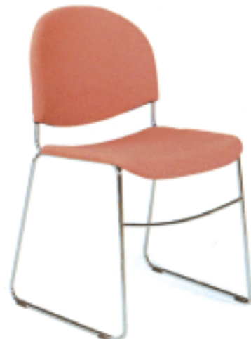
Assise et dossier totalement tapissés.