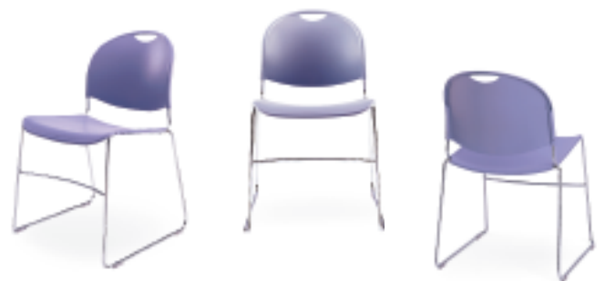
Polypropylène bleu et structure chromée.