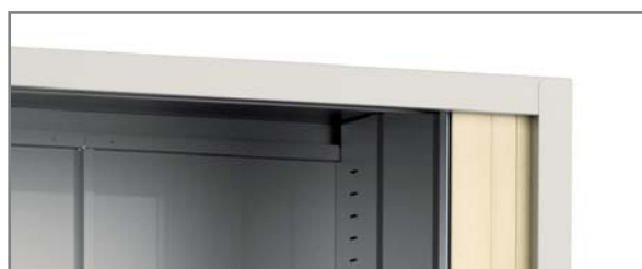
Detalle "bajo" H5-H6 / Dessous H5-H6 / Bottom feature H5-H6 / Ansicht Boden H5-H6