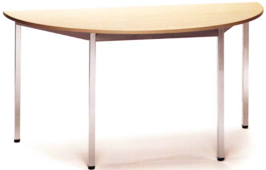
Melamina Haya Clara / Cromado Mélamine Hêtre Clair / Chromé Light Beech Melamine / Chrome Melamin Buche Hell / Verchromt