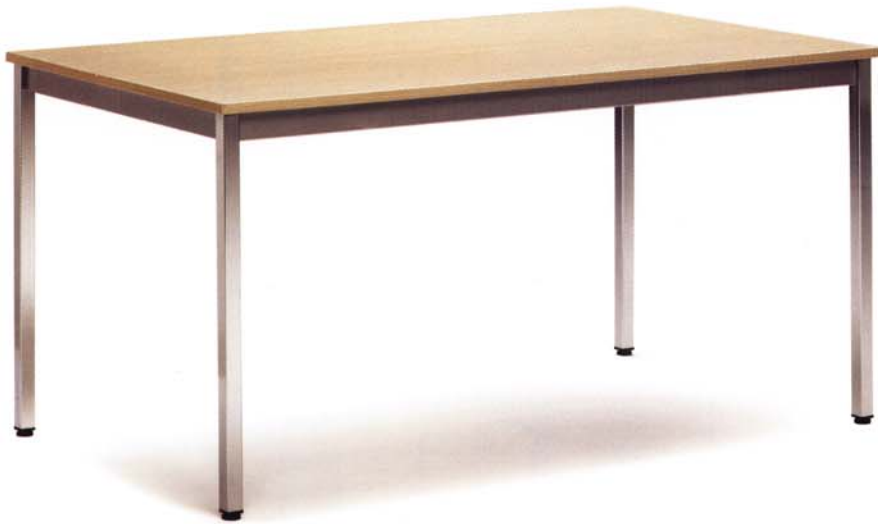
Melamina Haya Clara / Cromado Mélamine Hêtre Clair / Chromé Light Beech Melamine / Chrome Melamin Buche Hell / Verchromt