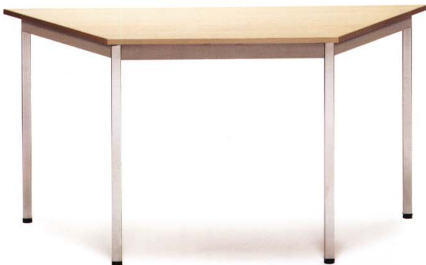
Melamina Haya Clara / Cromado Mélamine Hêtre Clair / Chromé Light Beech Melamine / Chrome Melamin Buche Hell / Verchromt